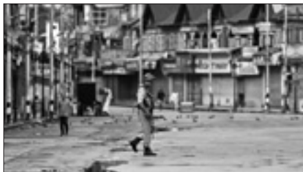
Una strada della zona di Lal Chowk a Srinagar

SRINAGAR, 21. Almeno 2.300 persone, per lo più giovani uomini, sono in stato di detenzione nel Jammu e Kashmir dove l'amministrazione dell'India ha imposto rigide misure di sicurezza e un blackout delle comunicazioni. Si tratta di provvedimenti decisi per ridurre i disordini dopo che New Delhi ha revocato, all'inizio di agosto, l'autonomia della regione. Migliaia di truppe indiane sono state inviate nella valle del Kashmir, già una delle regioni più militarizzate del mondo, per controllare i posti di blocco. Le comunicazioni telefoniche, la copertura