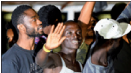
Migranti a bordo della Open Arms poco prima dello sbarco

Il procuratore aveva parlato nei giorni scorsi di una «situazione esplosiva», sottolineando l'importanza di riportare la calma ponendo