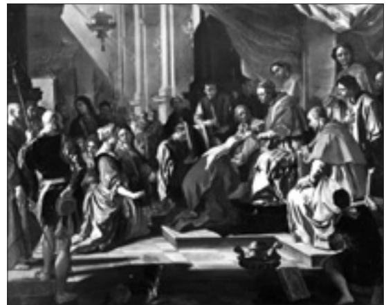
Francesco Solimena, «Clemente XI veste monaca sua nipote» (1710 circa, particolare)