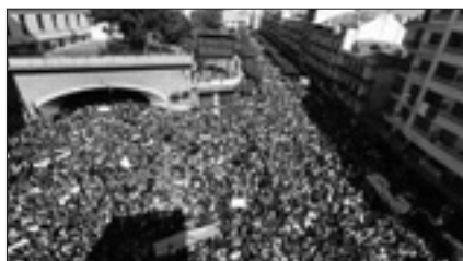
Strade di Algeri piene di manifestanti

Prima di iniziare il corteo, gli studenti hanno osservato un minuto di silenzio in ricordo del bambino di quattro anni morto domenica a causa del blocco degli accessi ad Algeri, imposto dall'esercito per impedire una manifestazione.