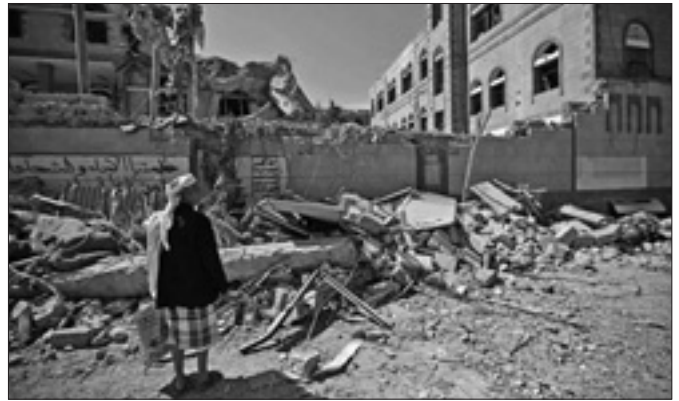
Allarme dell'inviato speciale dell'Onu

Un alto funzionario del Dipartimento di Stato degli Stati Uniti ha dichiarato che spetterà al Pakistan decidere se vuole portare la questione in tribunale. Ha poi aggiunto che secondo l'amministrazione Trump «una risoluzione in Jammu e Kashmir non sarebbe facilitata se la questione venisse posta in modo multilaterale: la risposta migliore è una conversazione diretta tra India e Pakistan».