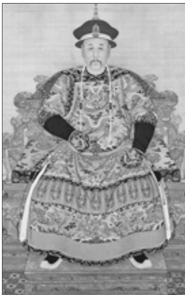
Un ritratto ufficiale dell'imperatore Kangxi

Nel 1742, Benedetto XIV condannò solennemente i riti, imponendo sanzioni gravissime e l'obbligo di uno speciale giuramento a tutti i missionari. La controversia finì, ma anche la missione iniziata da Matteo Ricci. Perdendo una battaglia così importante, i gesuiti subirono anche una pesante ripercussione circa la loro reputazione. Credo che l'amara sconfitta subita in Cina fu una delle cause che portò, nel 1773, alla soppressione della Compagnia di Gesù da parte del papa francescano Clemente XIV.