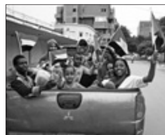
Euforia a Khartoum per la transizione democratica (Afp)

Il consiglio sarà guidato dal generale Abdel Fattah al-Burhan, già a capo del Consiglio militare, che presterà giuramento domani. Il consiglio sarà guidato da un generale per i primi 21 mesi e da un civile per i rimanenti 18 del periodo di transizione che terminerà nel 2022 con le elezioni.