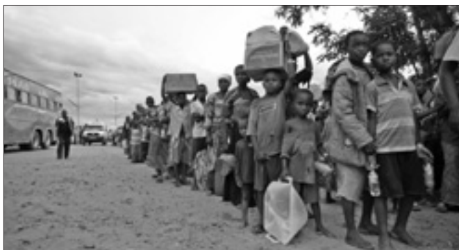
Un gruppo di sfollati

L'iniziativa ora è nelle mani del capo dello Stato, alla cui saggezza si affidano tutti per risolvere una crisi tutt'altro che semplice.