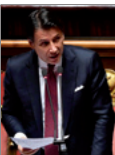
Giuseppe Conte

ROMA, 21. «L'azione del Governo si arresta qui». Con queste parole, pronunciate quasi a metà del suo intervento di ieri pomeriggio nell'aula di Palazzo Madama, il presidente del consiglio dei ministri italiano, Giuseppe Conte, ha aperto ufficialmente la crisi, annunciando che in serata si sarebbe tenuto il Quirinale per consegnare formalmente le sue dimissioni nelle mani del presidente della Repubblica, Sergio Mattarella. Il quale, dopo il breve incontro con Conte, non ha perso tempo, dettando subito il calendario delle consultazioni, che inizieranno questo pomeriggio e dureranno due giorni.