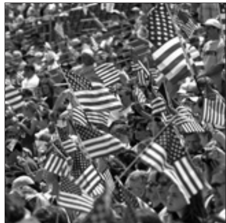
Documento di insegnanti di teologia negli Stati Uniti

guidare le persone alla profondità della verità, per ispirare una relazione fruttuosa tra i popoli e per condurre a un cambiamento di mente e di vita, alla comprensione e alla fiducia reciproca. Questo "timore di Dio" è diverso da quello esaltato dall'estremismo. È un momento di trasformazione che comprende la pace e la libertà e coltiva la virtù e la cooperazione. Nella teologia cristiana chiamiamo questo momento una conversione di cuore e mente che porta a una pacifica comunione con Dio, il nostro prossimo e tutta la creazione. Nonostante la difficoltà del compito che ci è stato affidato, rimaniamo fiduciosi sulla progressione dell'umanità verso uno stato di benessere condiviso. Questo è esattamente il motivo per cui tale visione deve essere promossa oltre le mura di questa assemblea, oltre le mura dei sacri siti religiosi e luoghi di culto. Religions for Peace è il centro di iniziative interdisciplinari e interreligiose che fungono da catalizzatore